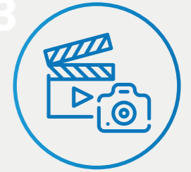
Foto & Video

Bewegtbilder sind das Medium mit der höchsten Interaktionsrate auf allen Kanälen. Ob emotionale Imagefilme, ansprechende Recruitingvideos, kreative Social-Videos oder detailverliebte Unternehmensfotos – wir kreieren Ihre unverwechselbare Bildsprache und setzen Ihr Unternehmen gekonnt in Szene.