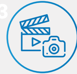
Foto & Video

Bewegtbilder sind das Medium mit der höchsten Interaktionsrate auf allen Kanälen. Ob emotionale Imagefilme, ansprechende Recruitingvideos, kreative Social Media Reels oder Unternehmensfotos – wir kreieren Ihre unverwechselbare Bildsprache und setzen Ihr Unternehmen gekonnt in Szene.