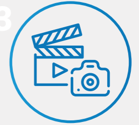
Foto & Video

Bewegtbilder sind das Medium mit der höchsten Interaktionsrate auf allen Kanälen. Ob emotionale Imagefilme, ansprechende Recruitingvideos, kreative Social Media Reels oder Unternehmensfotos – wir kreieren Ihre unverwechselbare Bildsprache und setzen Ihr Unternehmen gekonnt in Szene.