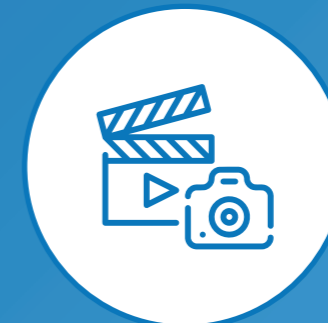
Foto & Video